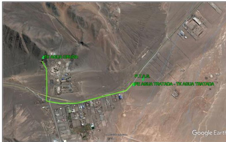
Figura 3: Trazado sistema 2