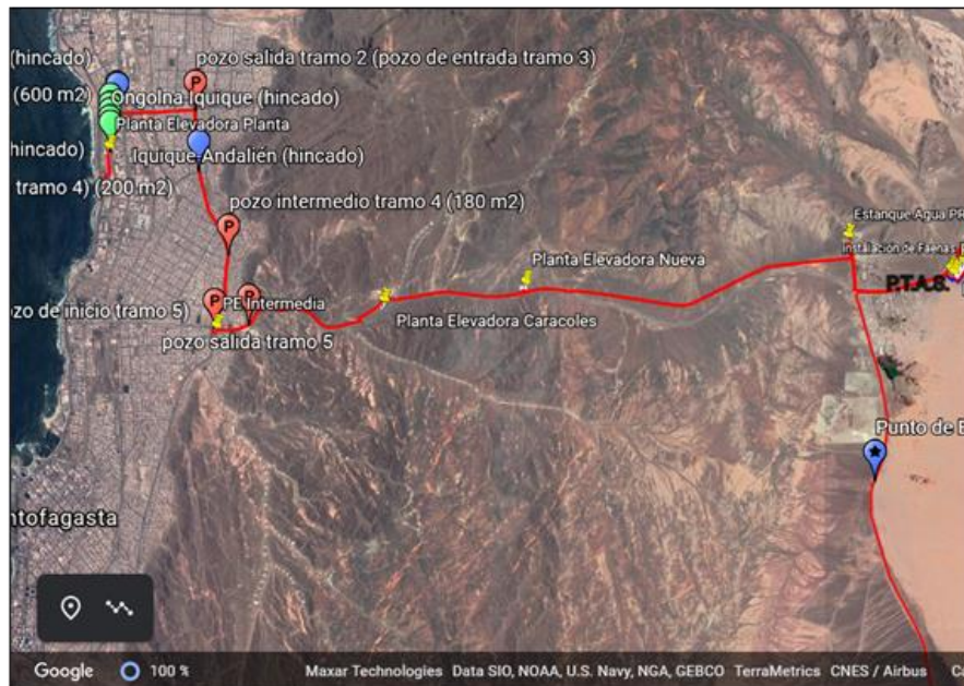
Figura 2: Trazado sistema 1